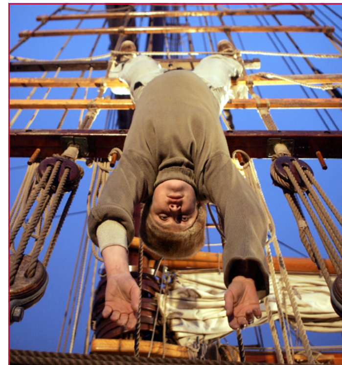
Das Letzte Kleinod

Montag bis Donnerstag: 9.00 – 16.00 Uhr. Freitag: 9.00 – 14.00 Uhr. Am Wochenende bleibt die Galerie geschlossen.